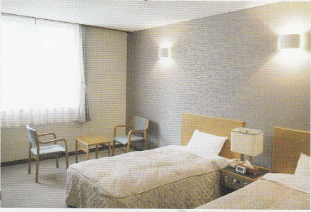
◆ 落ち着きのある洋室