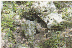
標高約560m。法華寺の北、通称「北谷」と呼ばれている山の中腹に位置している。

古橋の伝承によれば、関ヶ原合戦場逃れた三成は一旦、法華寺に身を寄せていましたが、追っ手から逃れるため、幼なじみの与次郎に案内され、オトチの岩窟に潜伏したといわれています。